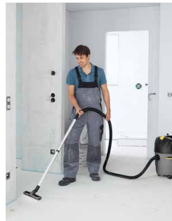
Kärcher Usisivač za mokro / suvo čišćenje - za mokru, suhu, grubu i finu prljavštinu

Ispitane za prašinu klase M Br. za narudžbinu: 6.907-479.0 Sadržaj : 5 komada