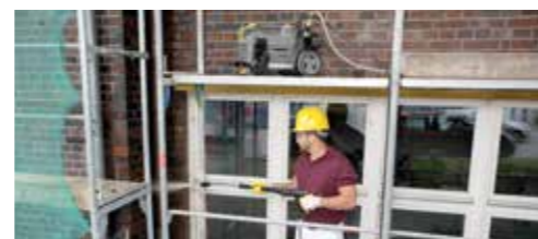
Radi veće stabilnosti može da se radi i sa položenom mašinom