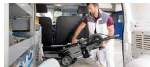
Mala težina i praktična ručka za nošenje