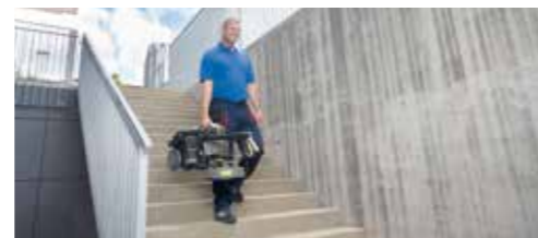
Veliki domet zahvaljujući dobošu sa 15 m visokopritisnog creva