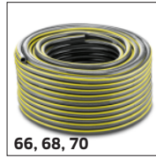
66, 68, 70