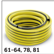
61-64, 78, 81